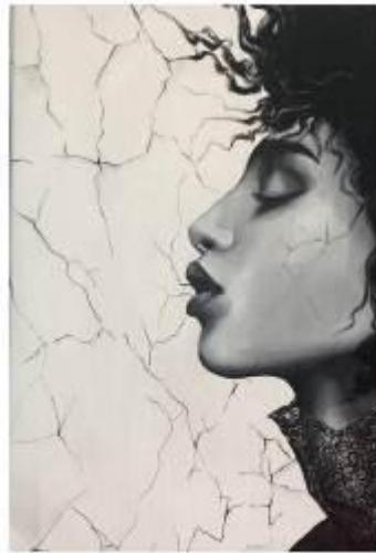
"Co...1" 30x50 Acrylic on canvas