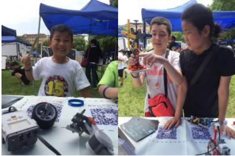
기타 소식 유치부-PS-A